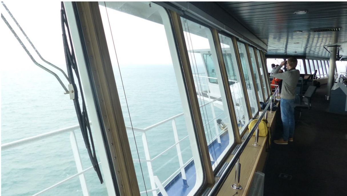
Foto 1.: Observer Ronald aan boord van de Stena Hollandica

Ook dit jaar is de monitoring vanaf de veerboten van de Stena Line, dat sinds 2005 loopt, voortgezet. Vrijwilligers hebben in 2018 elfmaal de tweedaagse overtocht van Hoek van Holland naar Harwich (UK) voltooid. Dit gebeurde in 2018 voor het 14e jaar. Deze monitoring van de Noordzee verloopt in internationaal verband; de European Cetacean Monitoring Coalition (ECMC).