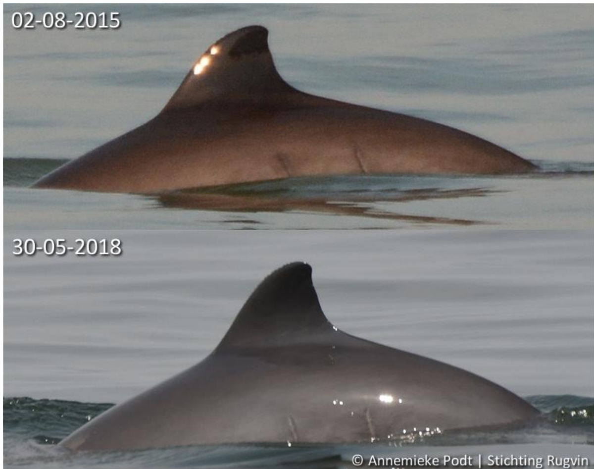
Foto 4 Bruinvis L009R042 uit de Oosterschelde waargenomen in 2015 en in 2018. Een duidelijke herkenning aan de littekens op de flanken.