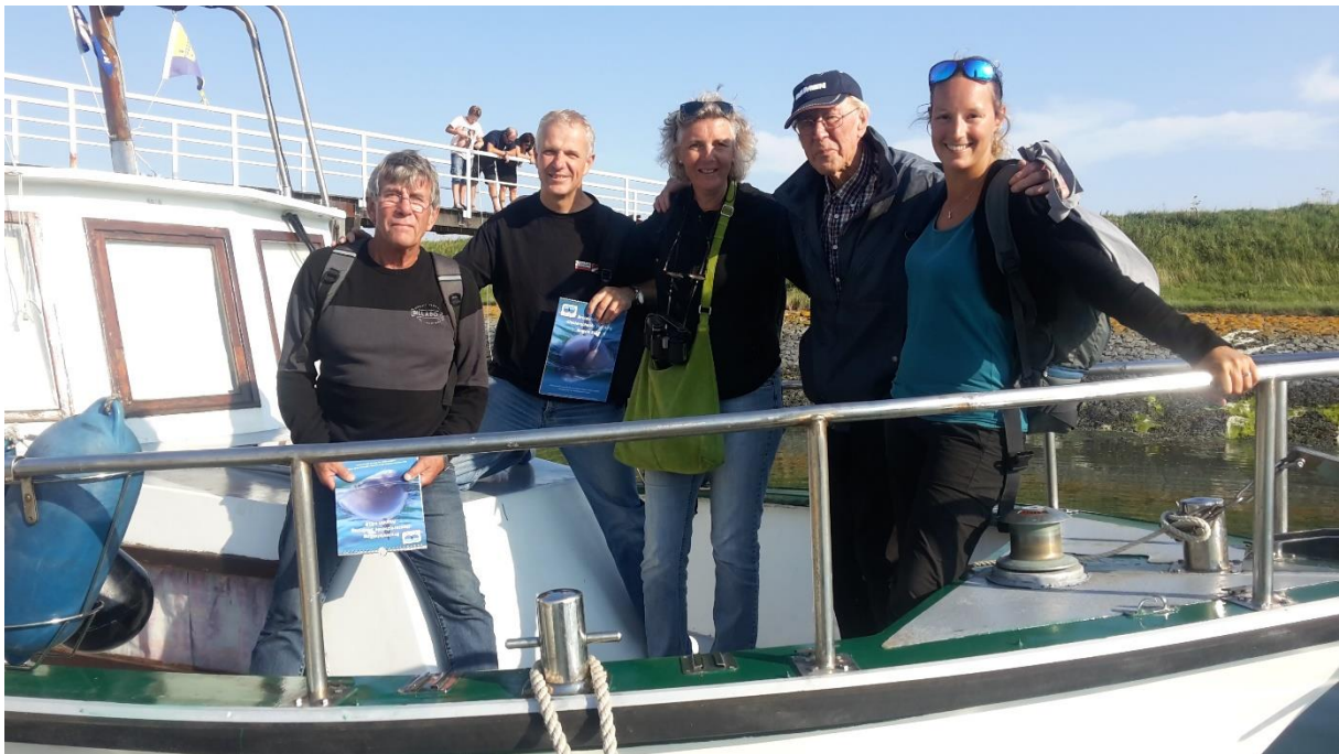
Foto 2: De bemanning van de Stern na afloop van de bruinvistelling van 2018

Deze jaarlijkse gebeurtenis wordt sinds 2009 uitgevoerd. Dit jaar vond de 10 e telling plaats op zaterdag 01 september. Tijdens deze dag zijn op de Oosterschelde minimaal 48 bruinvissen geteld. Dat is een toename ten opzichte van vorig jaar, toen 34 dieren werden geteld onder niet optimale omstandigheden doordat enkele boten uitvielen. Dit aantal van 48 dieren komt redelijk overeen met de dieren die zijn geïdentificeerd vanuit het Foto ID-project. De gedachten gaan nu uit naar een combinatie van deze twee onderzoeken.