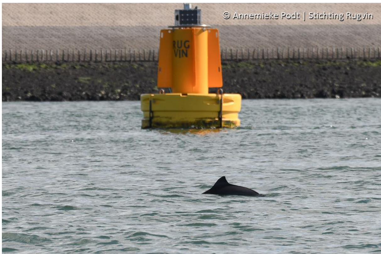
Foto 6: De Boei van Studio Bruinvis met op de voorgrond bruinvis L048R044.