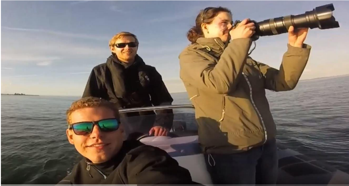
Foto 3: Het foto-ID-team aan het werk op de Oosterschelde op het Zeevarken.