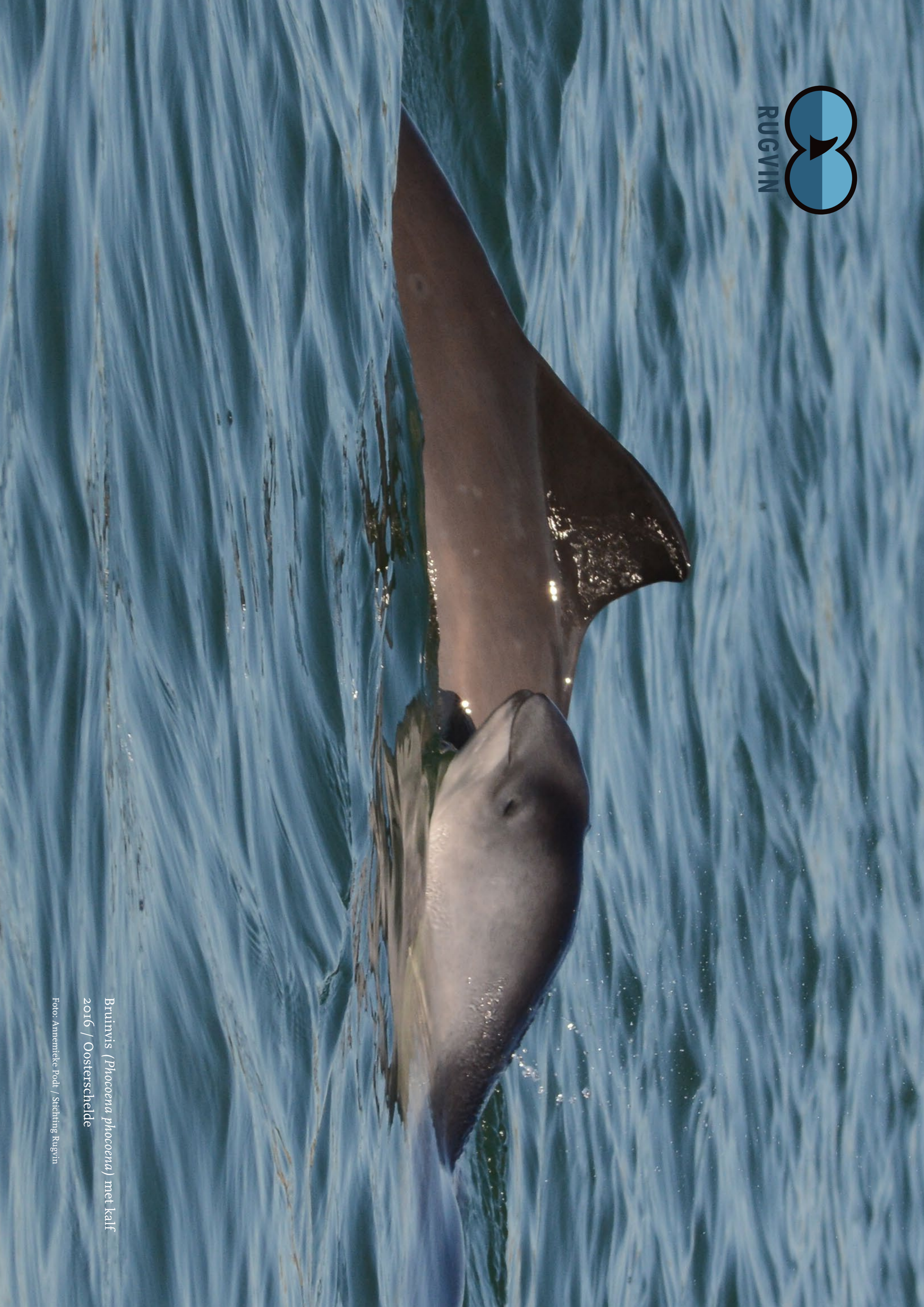
Bruinvis ( Phocoena phocoena ) met kalf 2016 / Oosterschelde